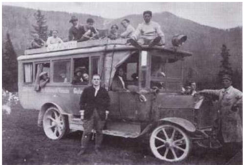
partecipanti alla prima gita del CAF sul Risnjak